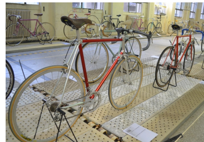
ΕΚΘΕΣΗ ΠΑΛΑΙΩΝ ΠΟΔΗΛΑΤΩΝ