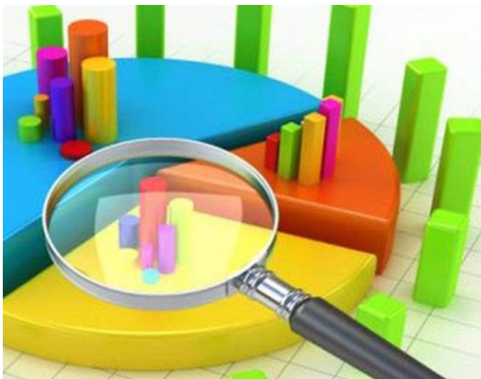
ΕΡΕΥΝΑ ΓΙΑ ΤΗΝ ΠΟΔΗΛΑΣΙΑ ΣΤΗΝ ΤΟΠΙΚΗ ΚΟΙΝΩΝΙΑ