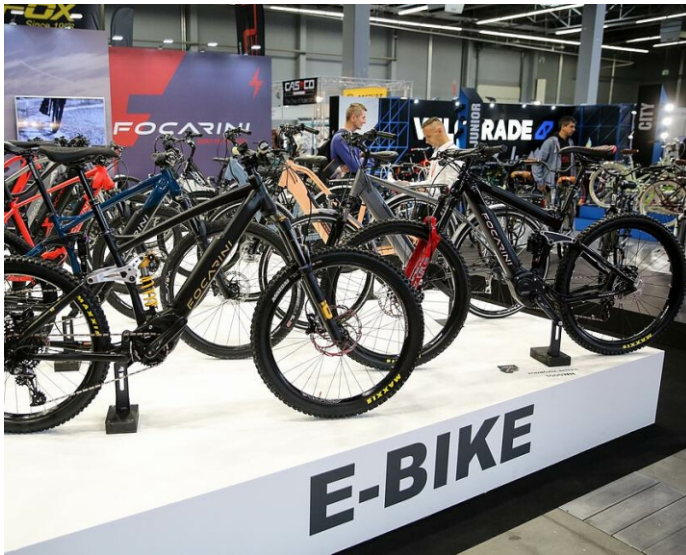
ΓΝΩΡΙΖΩ ΤΗΝ Ε-ΜΕΤΑΚΙΝΗΣΗ