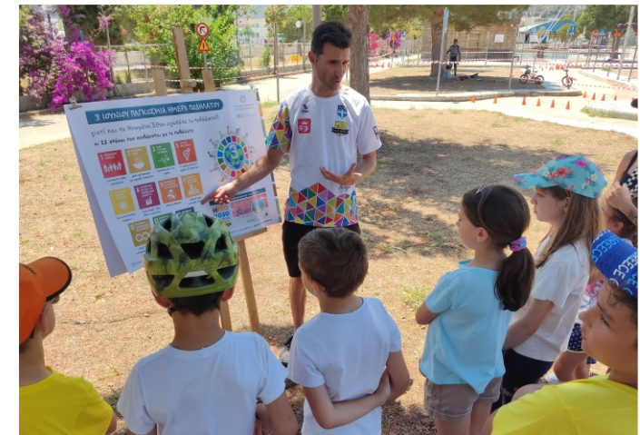
ΕΚΠΑΙΔΕΥΤΙΚΗ ΠΑΡΟΥΣΙΑΣΗ Οδικής Ασφάλειας