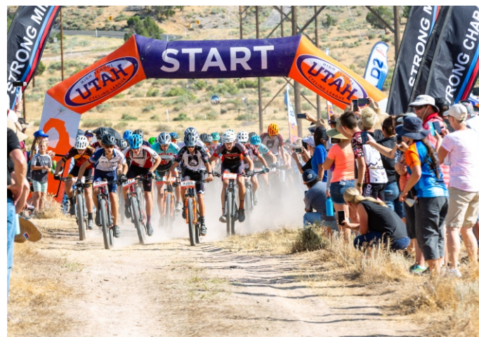
ΔΙΕΘΝΗΣ ΑΓΩΝΑΣ ΟΡΕΙΝΗΣ ΠΟΔΗΛΑΣΙΑΣ